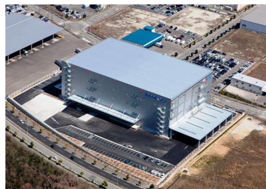
【山九㈱西神戸物流センター】