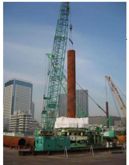
写真4 軟弱地盤上の高層マンションでの大深度施工