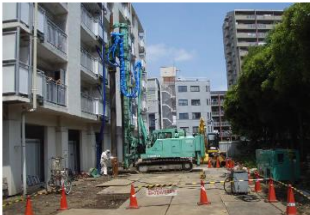
写真3 集合住宅耐震補強の狭隘地施工