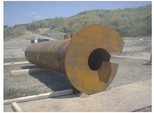
写真1 NSエコパイル外観

土木分野 (鉄道・道路施設、送電鉄塔等)、 建築分野 (公共施設、マンション・事務所ビル、工場設備等) で全国多数実績有り